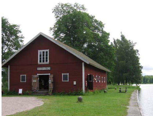
Kanalmagasinet i Hajstorp

Hembygdsföreningen ansvarar för det ena projektet och kommer att iordningställa ett museum med äldre bruksföremål. Museet ska spegla hur det vardagliga livet var i bygden förr i tiden. Den ekonomiska föreningen Hantverk kring kanalen kommer i sitt projekt arbete med utställningsteknik för hantverk och försäljning samt marknadsföring. Eftersom båda projekten berör Kanalmagasinet kommer de att samarbeta med varandra. Sommaren 2011 ska allt vara klart.